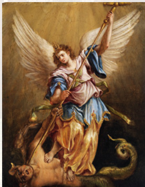
Giovanni Baglione Der Erzengel Michael im Kampf mit dem Drachen

Sehnen wir uns vielleicht manchmal nach einem solchen Engel? Dass da einer ist, der uns hilft, das Schwere im Leben zu tragen. Einer, der uns zur Seite steht. Einer, der auch mal durchgreift, auf den Tisch haut, um für uns zu kämpfen, uns zu verteidigen.