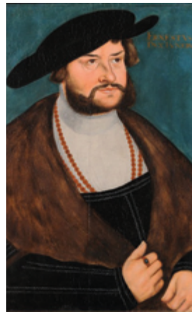
Ernst der Bekenner, Gemälde von Lukas von Cranach dem Älteren