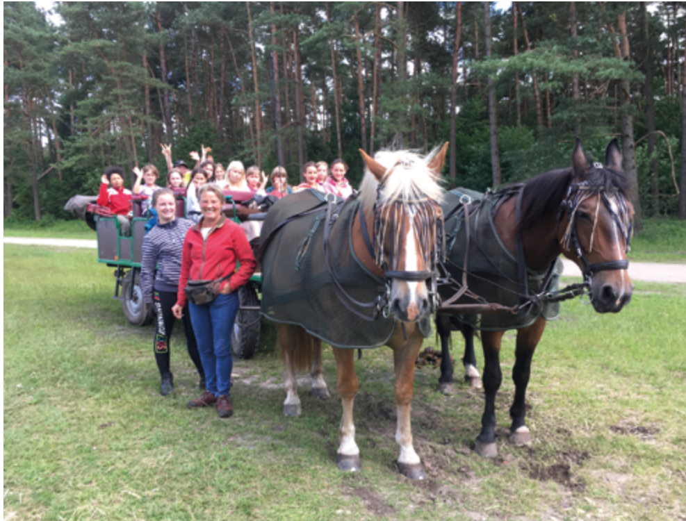
Kinderferientag in der Heide